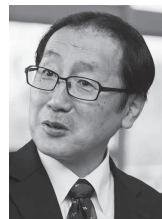
眞鍋淳一